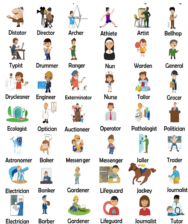
Imagen creada con IA